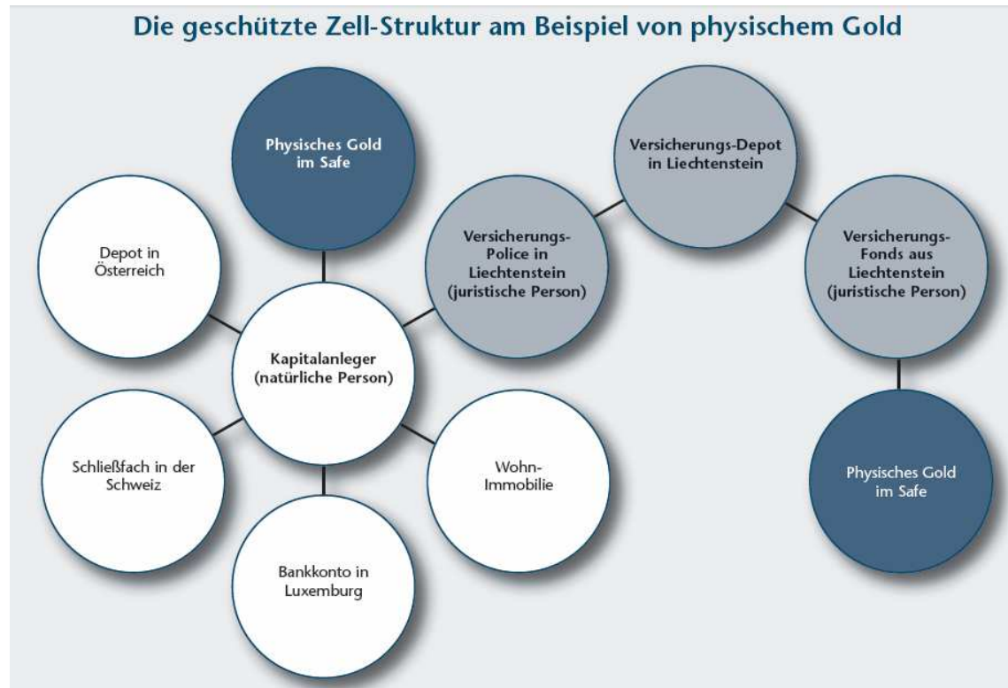
Die geschützte Zell-Struktur am Beispiel von physischem Gold

Kapitalschutz: Schaffen Sie eine geschützte Zell-Struktur für Ihre Vermögenswerte